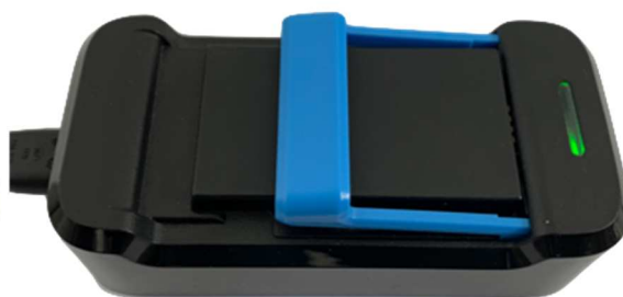
Afbeelding 6: volledig opgeladen accu