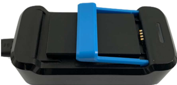
Afbeelding 5: onjuist geplaatste accu

U krijgt een oplader mee naar huis om de meegeleverde accu's mee op te laden. Het is belangrijk dat u de lege accu uit de recorder oplaadt. Zorg ervoor dat de accu goed in de oplader geklikt wordt. Gemiddeld duurt het opladen van een accu 2 uur . Zodra het lampje van de oplader continu groen brandt, is de accu volledig opgeladen (zie afbeeldingen 5 en 6).