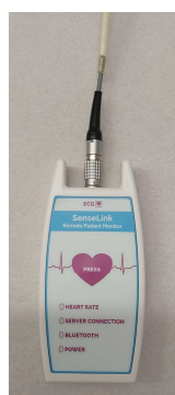
Afbeelding 7 recorder met kabel

De eventrecorder is niet waterdicht. Wanneer u gaat douchen of baden, haalt u de kabel van de plakkers. Haal de stekker van de kabel niet uit de recorder (zie afbeelding 7 en 8).