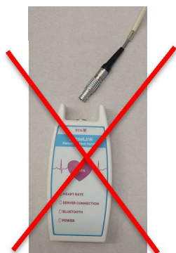
Afbeelding 8 recorder met kabel eruit

Leg de recorder met de kabel op een plaats waar ze droog blijven. De plakkers haalt u voor of tijdens het douchen / baden voorzichtig van de huid. De gebruikte plakkers kunt u weggooien.