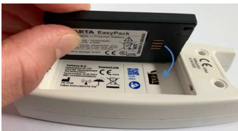
Afbeelding 3: correct verwisselen accu

Let op: voelt u dat het klepje niet goed dicht gaat? Controleer dan of u de accu juist geplaatst heeft (zie afbeeldingen 3 en 4).