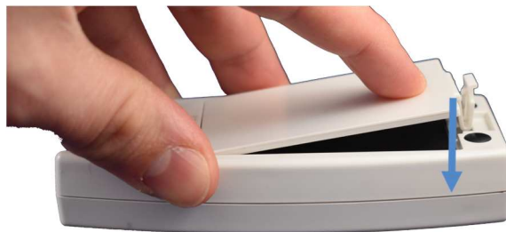
Afbeelding 4: correct sluiten van het klepje