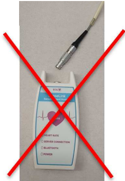
Afbeelding 8 recorder met kabel eruit

Leg de recorder met de kabel op een plaats waar ze droog blijven. De plakkers haalt u voor of tijdens het douchen / baden voorzichtig van de huid. De gebruikte plakkers kunt u weggooien.