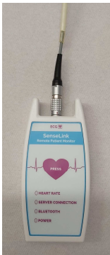
Afbeelding 7 recorder met kabel

De eventrecorder is niet waterdicht. Wanneer u gaat douchen of baden, haalt u de kabel van de plakkers. Haal de stekker van de kabel niet uit de recorder (zie afbeelding 7 en 8).