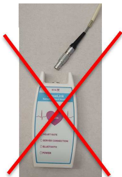
Afbeelding 8 recorder met kabel eruit

Leg de recorder met de kabel op een plaats waar ze droog blijven. De plakkers haalt u voor of tijdens het douchen / baden voorzichtig van de huid. De gebruikte plakkers kunt u weggooien.