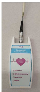
Afbeelding 7 recorder met kabel

De eventrecorder is niet waterdicht. Wanneer u gaat douchen of baden, haalt u de kabel van de plakkers. Haal de stekker van de kabel niet uit de recorder (zie afbeelding 7 en 8).