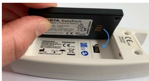
Afbeelding 3: correct verwisselen accu

Let op: voelt u dat het klepje niet goed dicht gaat? Controleer dan of u de accu juist geplaatst heeft (zie afbeeldingen 3 en 4).